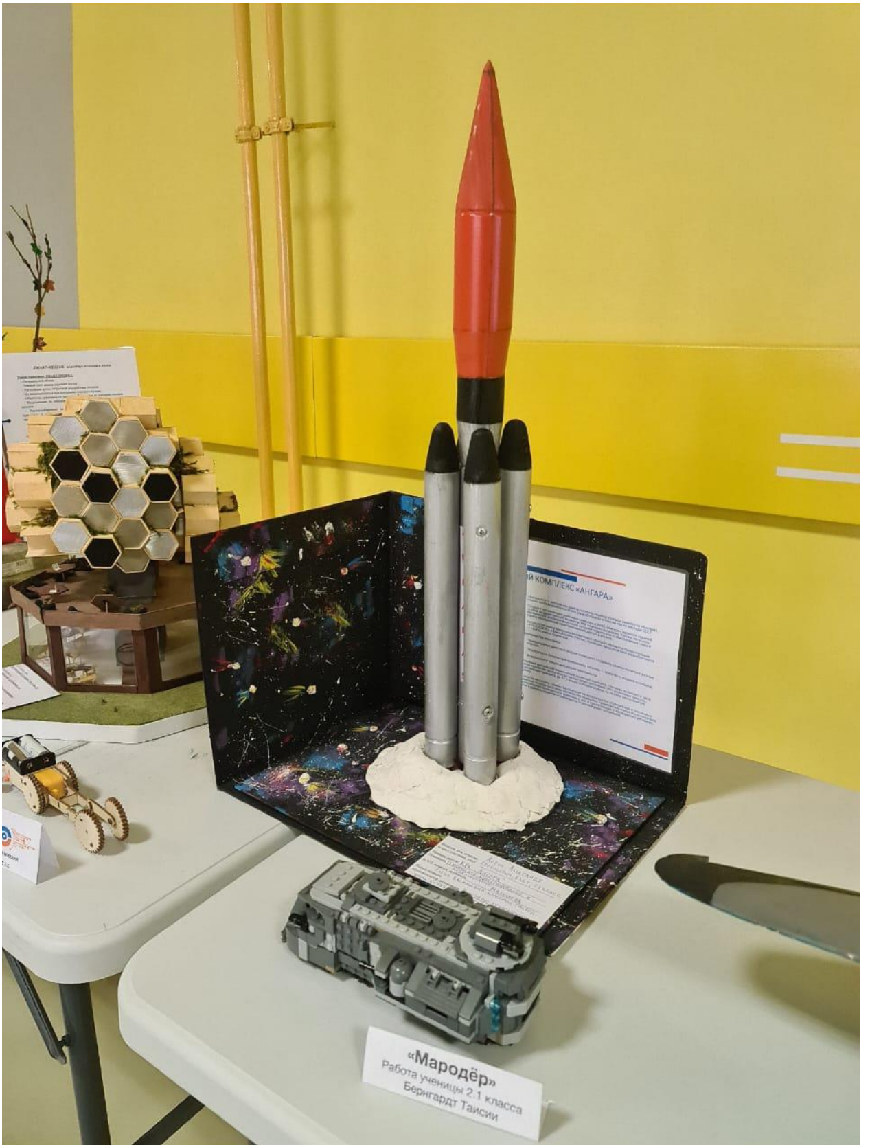
«Мародёр» Работа ученицы 2.1 класса Бернгардт Таисии